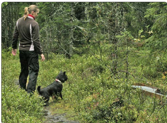
Ayni går direkte frem til skrammelet

terrier for ingenting! Til vanlig bryr hun seg heller ikke om lyder; verken ringeklokken, nyttårsraketter, torden eller skudd i skogen når vi er på tur.