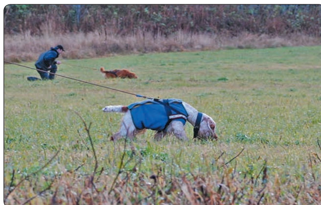
Hayley på sporet.