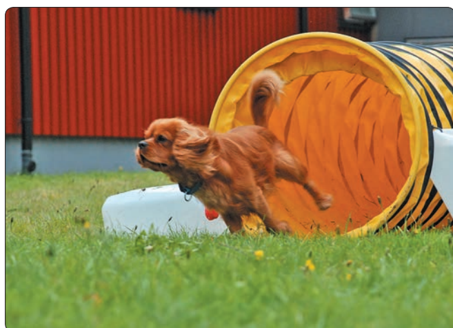
Jahro på full fart ut av tunnelen med fokus på neste hinder.