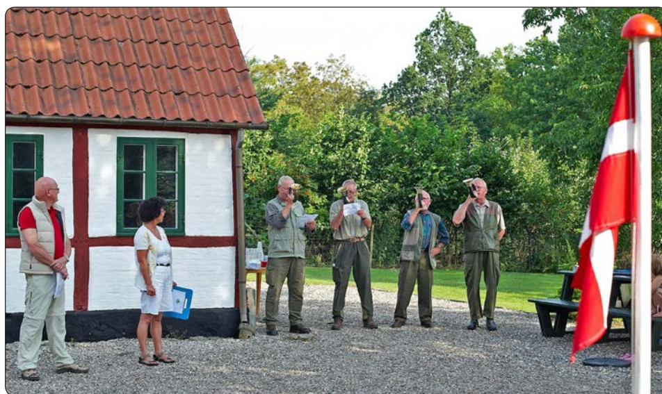
Det blir en spesiell og høytidelig stemning når hornblåserne, som blåser fanfare når en hund finner viltet på slutten av sporet, viser sine talenter før mesterskapet starter.

Sporoppsøket vårt lå oppe på en liten kolle der det lå igjen litt kvist og bar etter hogst av noen storgraner året før. Jeg syns det kom en liten luft-trekk fra venstre og valgte å starte Remus litt til høgre i oppsøksruta. Så var vi i gang! Jeg lot lina gå til Remus var 5-6 meter inne i ruta før jeg rolig fulgte etter. Nå gjaldt det å se om han "slo på" noe og merke seg det i tilfelle han gikk over blod og jeg burde føre ham tilbake. Etter en liten runde mot