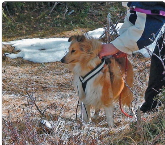
Til venstre seles sheltien Tessa på før sporstart.