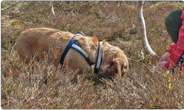
Over har Otto funnet sporslutt.