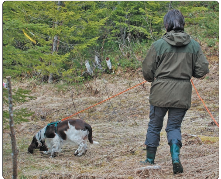
Lotta er svært spornøye og holder et behagelig tempo.