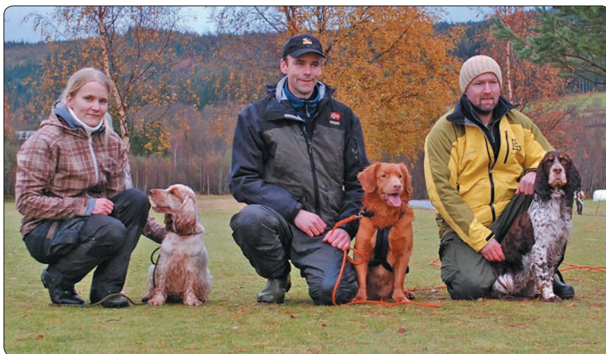
De tre beste på KM-pinnespor 2009.