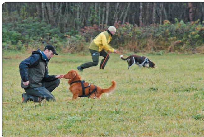
Remus og Luna ved andre apport.