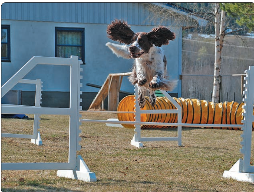
Tulla er ei spenstig frøken som elsker å hoppe. Hun går i klassen for videregående og konkurrerer i agility og agility-hopp sammen med matmor Borghild.