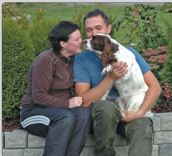
Kennelens nyeste tilskudd - working springer Fantin's Vilja

Ellers kan jeg fortelle at Apollo har vært stilt ut 10 ganger i år, og fått 9 CK, 6 cert - hvorav 3 er storcert, 1 CACIB samt 2 BIR, BIS og BIS2. Han er trolig historiens eneste norsk-fødte springer som har opp-nådd BIS på en int NKK utstilling!