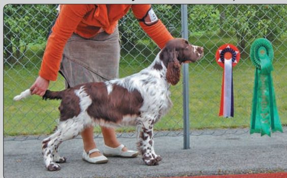
Felix (Winton The Winner Takes It All)