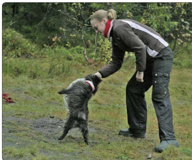
Ayni leker, selv om det blir avfyrt skudd

Mens man leker, kommer moment ti: skuddet. Man skal se hvordan hunden reagerer på skudd både under aktivitet (lek) og under passivitet. Ayni lekte som sagt med fillen, og skuddet kom. Hun kunne nok knapt brydd seg mindre – fillen hennes var jo her og hun fikk lov å leke! Så fikk vi beskjed om å stoppe og leke: et nytt skudd ble avfyrt mens vi stod i ro, men heller ikke nå brydde hun seg. Da fikk vi fortsette å leke igjen, og MHen var ferdig.