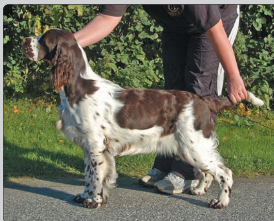
Zeline (Winton That's Me)