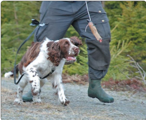
Under trigges Aco på rådyrskanken.