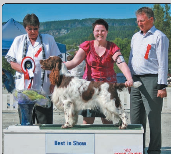
Apollo BIS på NKK-Stjørdal (Winton Man On The Moon)

5/9, NSK avd Østfold, dommer David Shields SU(u)CH N UCH Trollängens My Carnation - BIR og BIS2! Winton Man On The Moon - 2.bh med cert C.I.B. NORD UCH N S VCH WW-08 FINV-08 Barecho Zimply Zuper - 3.bh C.I.B. NORD UCH N S VCH JWW-06 FINV-08 Barecho Fly Me To The Moon - 3.bt Winton That's Me - BIR og BIS valp!