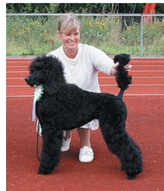
BELLA 2X BIM