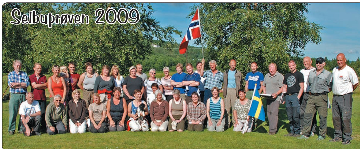
Deltakere, dommere og gode hjelpere på Selbuprøven 2009

/ Tekst ToneGL