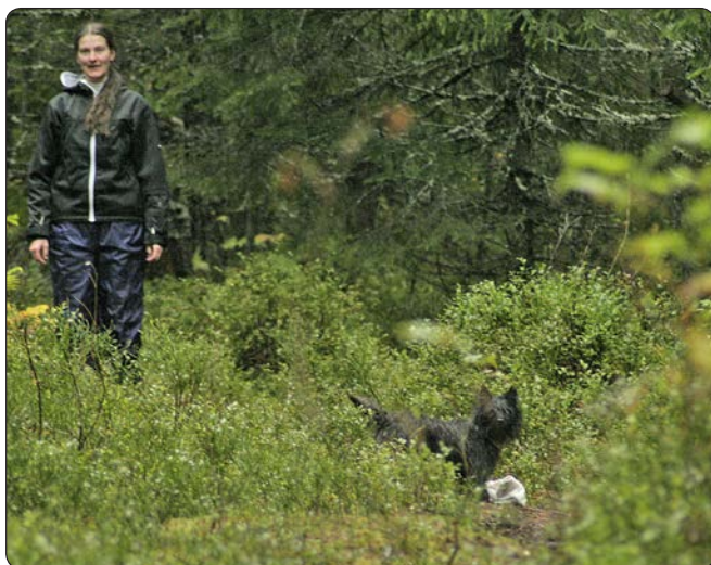
Ayni står med fillen og lurar på om vi får med oss at hun har det gøy i skogen, mens figuranten er passiv under avstandslek

Ayni husket fillen – så med en gang jeg slapp henne beinet hun innover i skogen. I følge figuranten var hun på vei til å løpe forbi henne da hun i sidesynet fikk øye på fillen, snudde sidelengs i luften og snappet til seg fillen "sin". Det er egentlig ikke meningen at figuranten skal miste fillen, men den lille mørke hunden kom nok litt brått på...! Når hunden har kommet frem til figuranten, skal figuranten gå