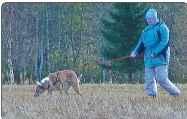
Jelly var Yngste deltaker i år.