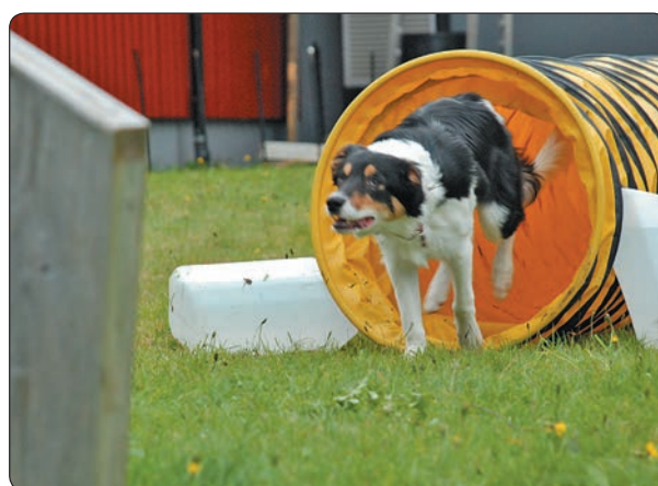
Sammy har et hinder igjen før han kan få belønninga si.