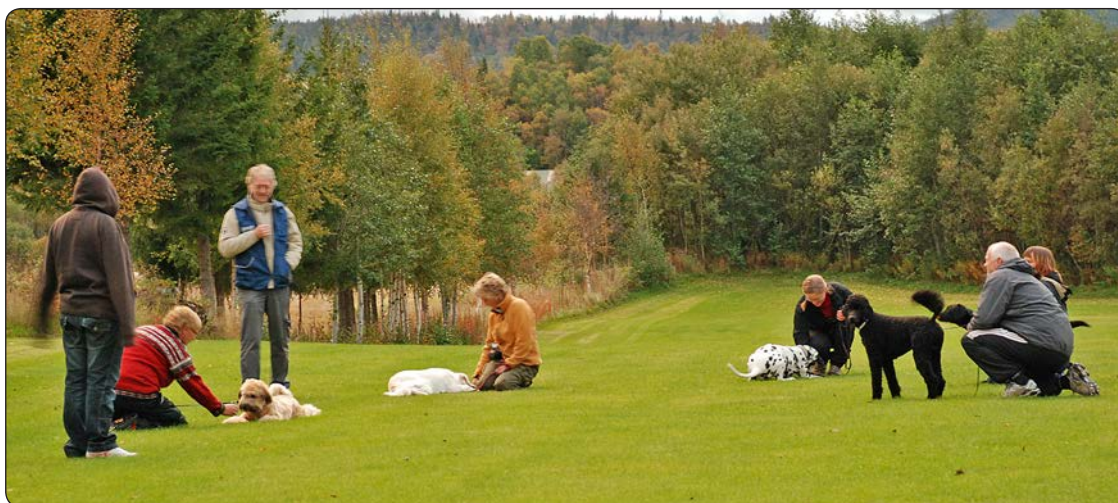
Bildet viser deltakerne på høstkurset.