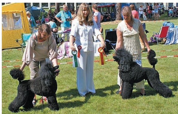
PIE 5XCERT 5XBIM