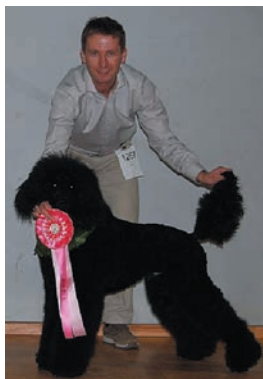
MILO 3XBIR 1XBIM BIS VALP ORKANGER 09