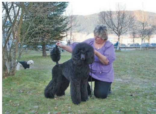
KAISA 10XBIR 1XBIM 2X BIG4