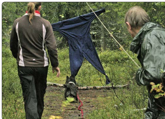
Ayni viser terrier'n i seg

Det er mange raser som reagerer med å flykte, og som trenger lang tid på å tørre å gå frem og snuse på kjeledressen, Ayni var helt uanfektet etter "sjokket". Hva som er ønskelig på dette momentet vil variere med rase; for en mykere hund som en spaniel eller retriever er det mer naturlig at viser mye mer redsel. Det som da er viktig, er at hunden avreagerer, det vil si at den kommer over redselen og ikke bryr seg mer om kjeledressen når den har funnet ut at den ikke var så farlig likevel.