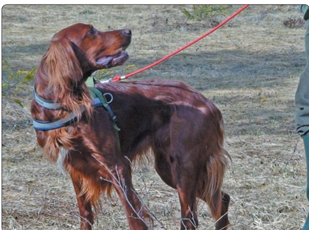
T.v. "Skal vi starte nå?" lurer Tell.