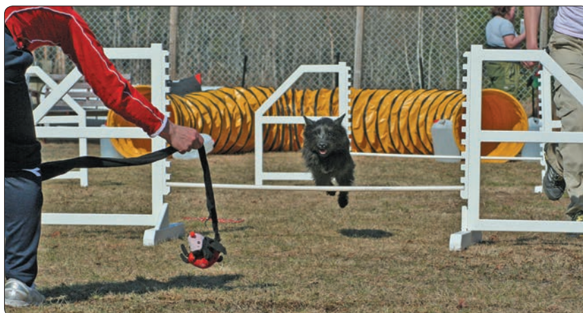
Cairn terrier'n Ayni hopper gjerne hinder for å få leke drakamp.