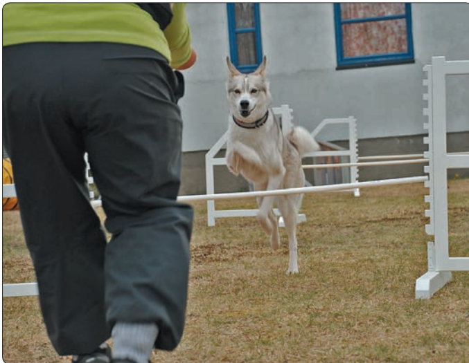
Gaia er en husky som liker å løpe og hun synes tydeligvis at agility er en artig aktivitet.