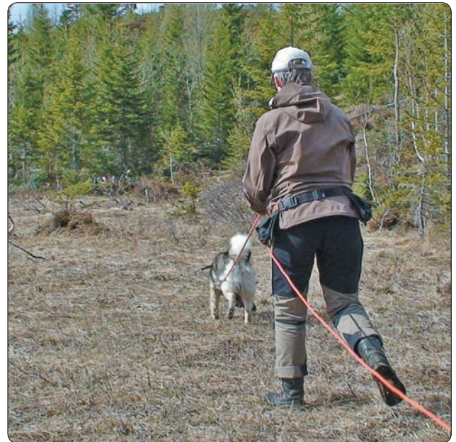
Under er Odin godt i gang med sitt spor.