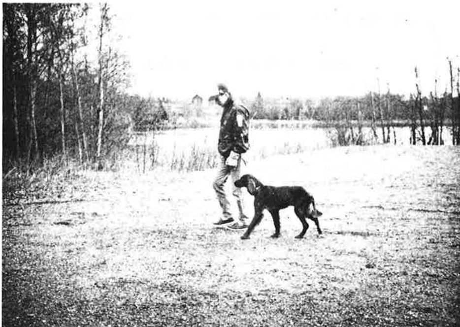
Jakthunder kan også dresseres i vanlig appell.

Til tross for et vårvær som varierte mellom vannrett snøstorm og loddrett regn - noen ganger var det til og med opphold - stilte folket opp stort sett hver mandag og torsdag, som var kurskveldene. Deltakerantallet var rekordartet - 15 hunder m/eiere! Det var stor spredning i rasene, fra den minste tibetanske spaniel til den største schäferhund. Uansett rase - alle hunder liker å jobbe med noe - og bruke hodet.